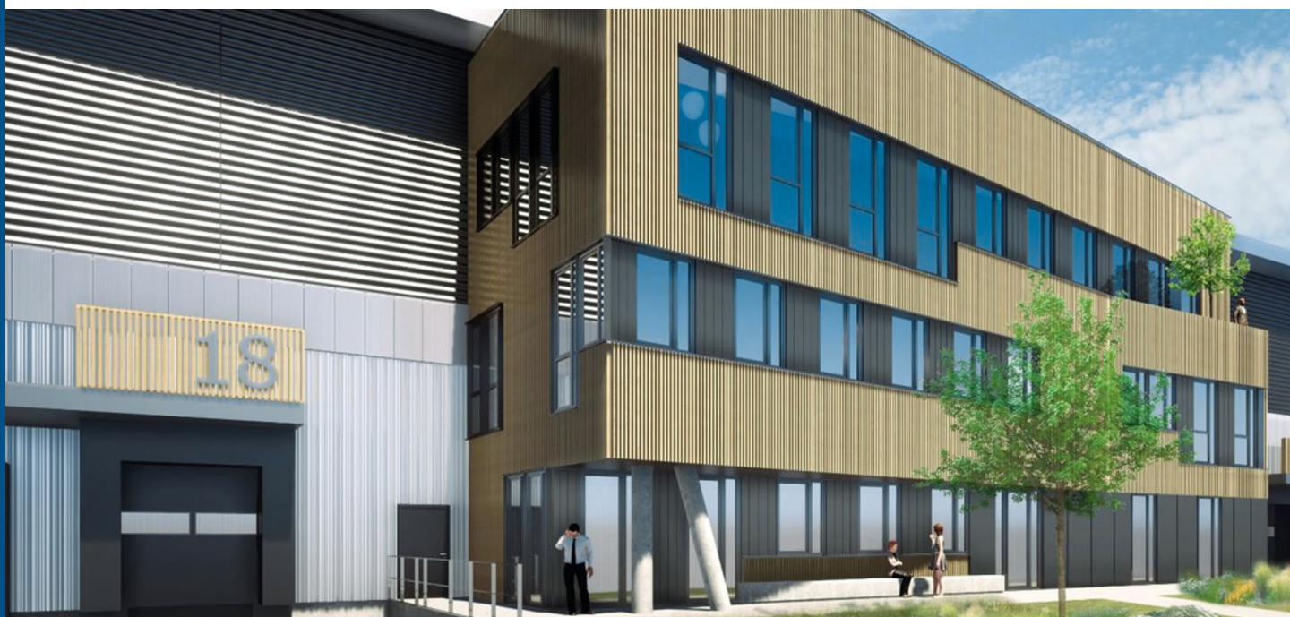
Perspective : Cabinet A26