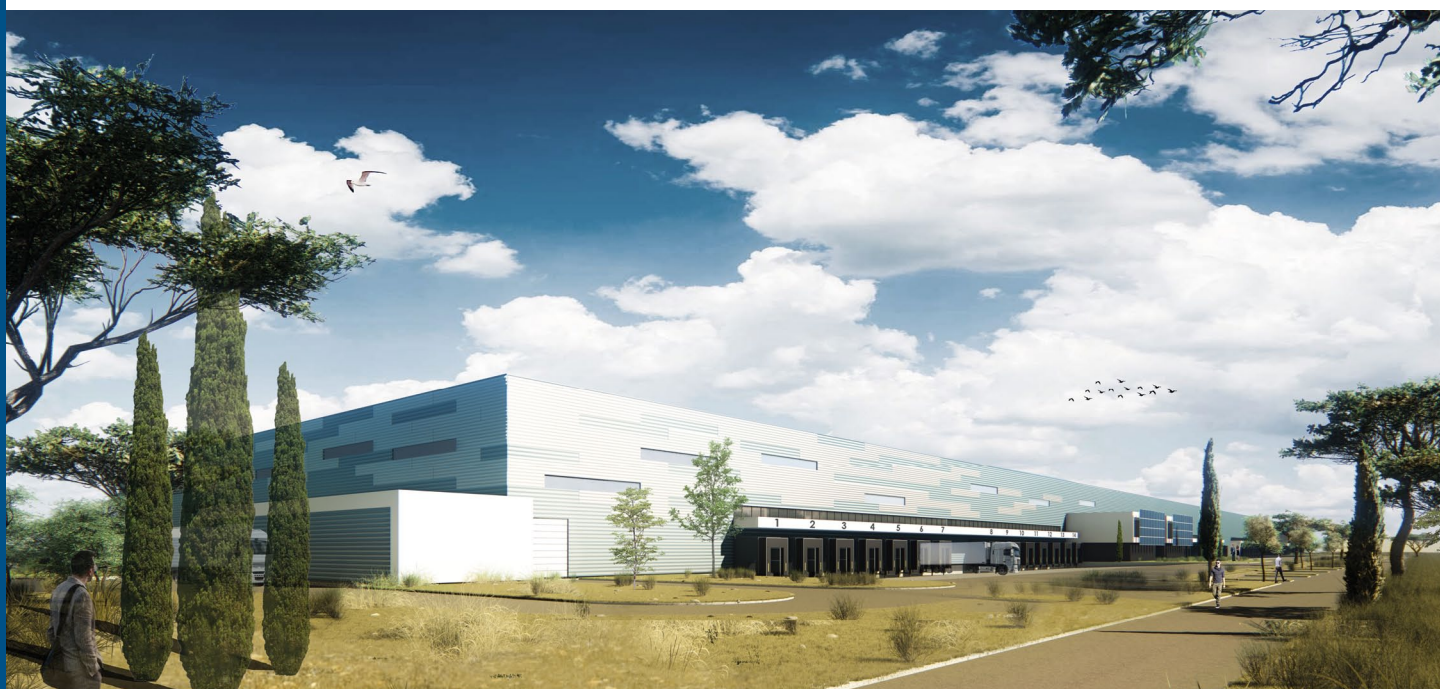
Perspective, Cabinet d'architecture Archigroup