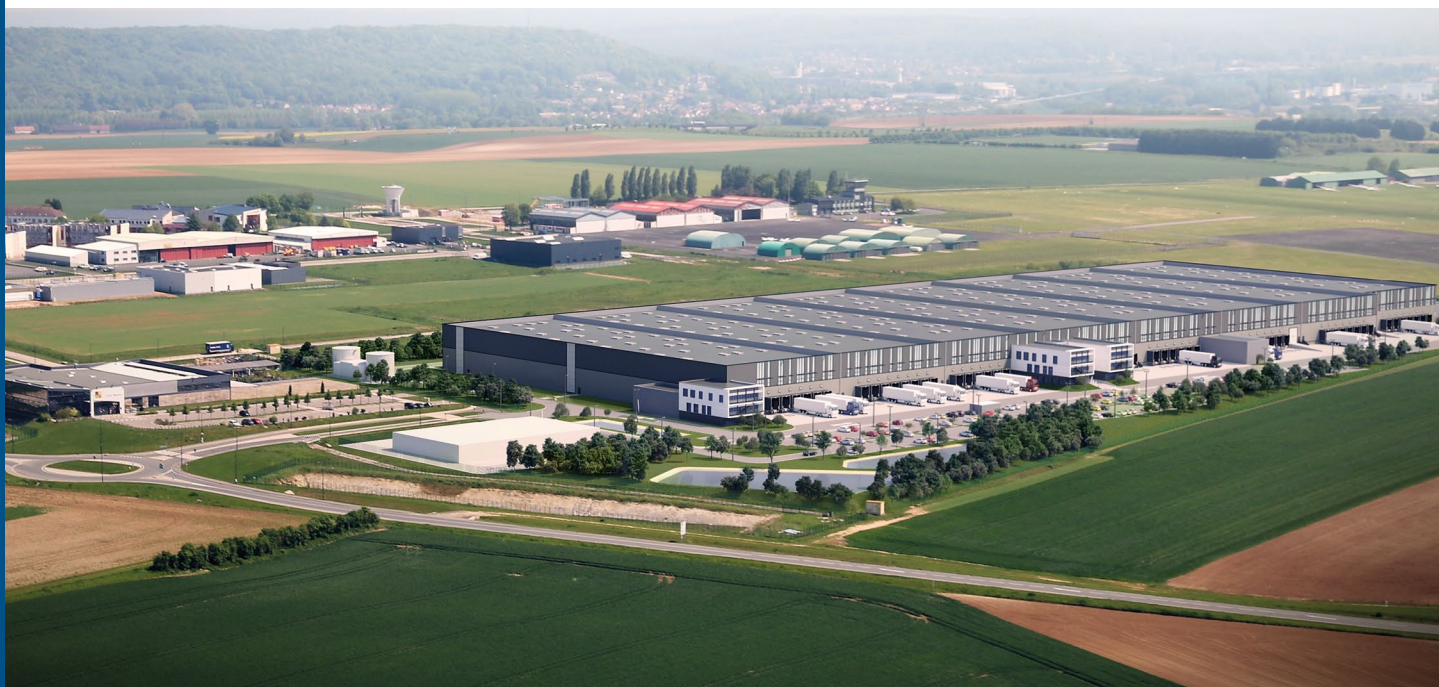
Perspective, Cabinet d'architecture Atelier 4+