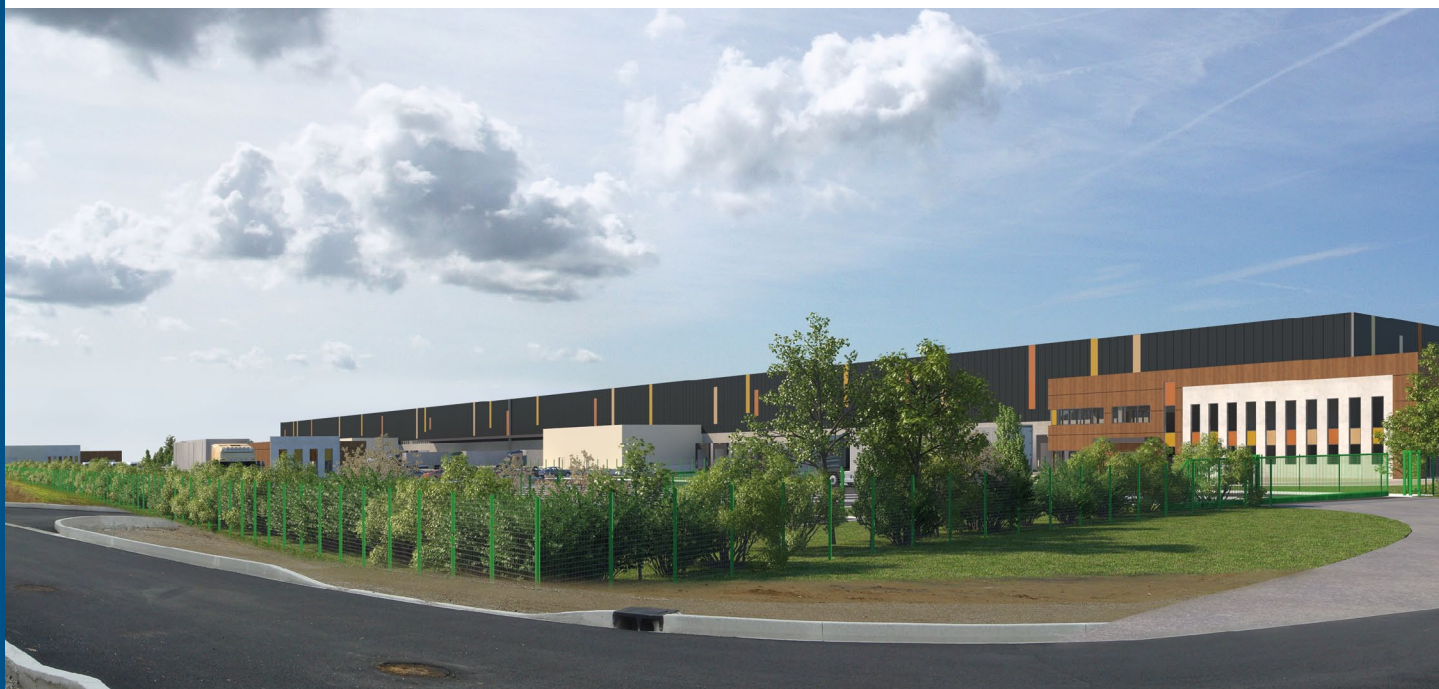
Perspective, Cabinet d'architecture A26